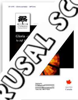
Gloria: the cantata

other beautiful recordings by Jeff Enns - in the Cypress Choral Music catalogue: