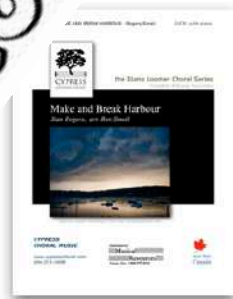
Make and Break Harbour SATB and TTBB