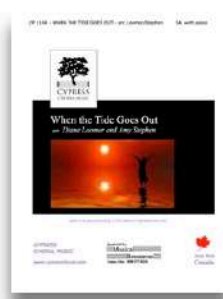
When the Tide Goes Out SA