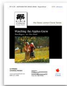
Watching the Apples Grow SATB and TTBB