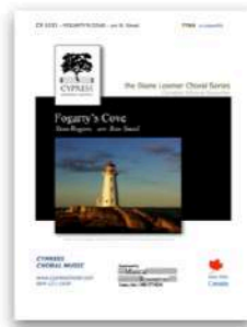
Fogarty's Cove SATB and TTBB